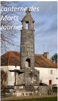
Lanterne des Morts Journet